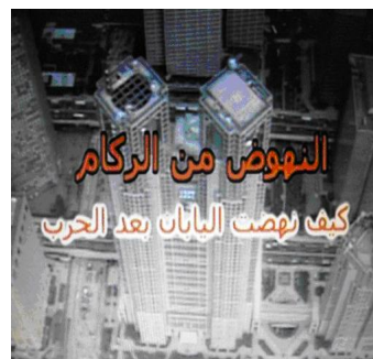
Documentary entitled "Up from the ashes" which depicted how Japan achieved its postwar recovery (Arabic version)