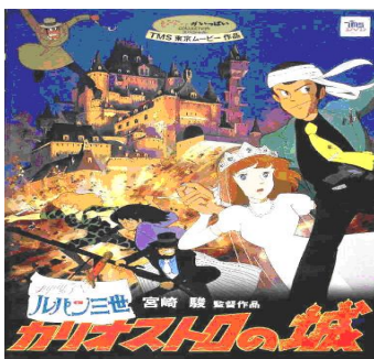
The animation film movie which was shown (TMS ENTERTAINMENT,Ltd)