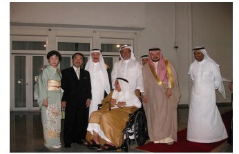
Top businessman and H.E. Mr. Tyyab