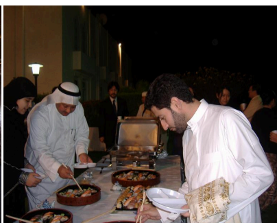
Japanese enjoy "Saudi food dishes"