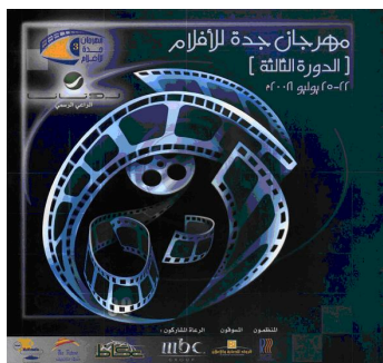
Jeddah Film Festival Brochure

On the night of 23 July when the Japanese films were screened, 150 viewers gathered at the auditorium in the Jeddah Chamber of Commerce and Industry (JCCI). They appreciated not only the films themselves but also the social significance in the screening of Japanese films. They could enjoy the films on a large screen. The film show on that night came to a close with a very favourable response.