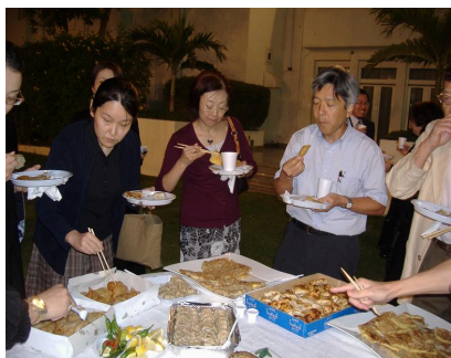
Saudi homemade dishes